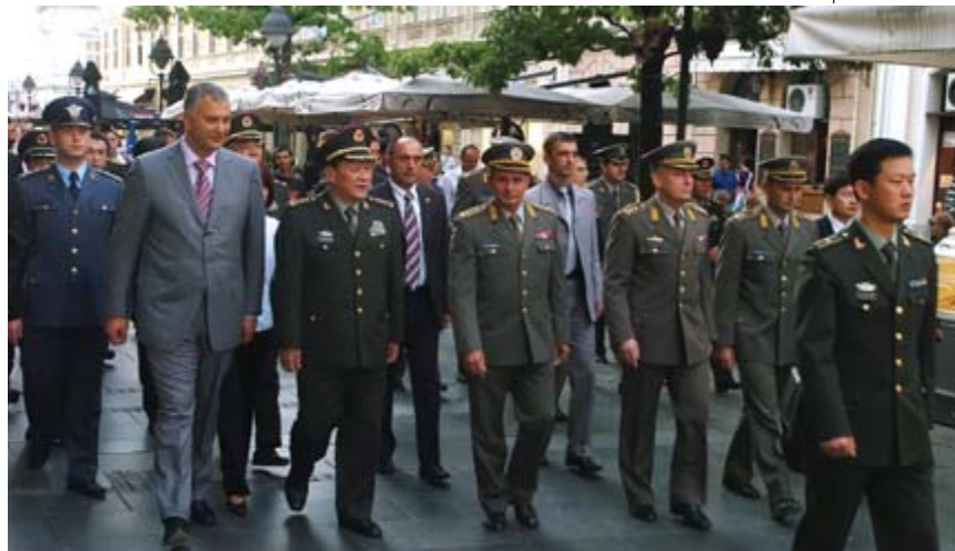
Посета министра одбране Кине генерала Лијанга

И током недавне посете министра одбране Кине генерала Лијанга Гуанглија, прве после 25 година, закључено је да су односи у области одбране најбољи у укупним односима две земље. У фокусу разговора били су јачање традиционалног пријатељства, обука кадра, пројекти у вој-